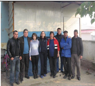
FOTO DE GRUP